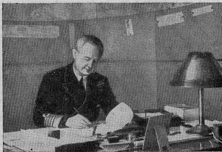
Almirante Cumhigans, Jefe de la Flota Aliada en el Mediterraneo donde se ha cubierto de glorias inmarcesibles al lograr cobijar con el fuego de las baterías navales a las fuerzas de asalto en las costas de Sicilia. Su nombre pasará a la historia al lado de Nelson y otros inmortales.