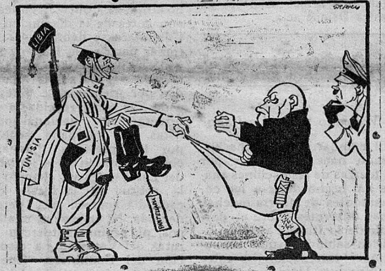
Ahora tus pantalones, hasta dejarte desnudo.

Londres 4. a. m. Julio 26.—Radio Roma anuncia hoy la caída del Primer Ministro y Pasa a la Pág. 8